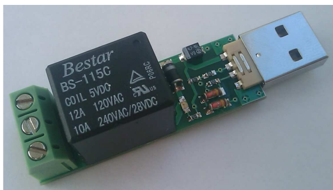
Рис.1 Общий вид устройства.